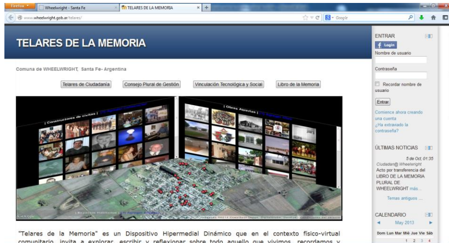
Fig. 1. Portada Telares de la Memoria.

Ante esta situación, se plantea la necesidad de construir un contexto físico-virtual de carácter inclusivo, atendiendo a las características de la interactividad existente [12], la calidad y tipos de mediatizaciones, la disponibilidad de infraestructura tecnológica y de servicios, adaptabilidad, flexibilidad y dinamismo de los sistemas digitales en uso, respetando la diversidad cultural e impulsando la producción y diseminación abierta del conocimiento a través de redes socio-técnicas colaborativas y de participación ciudadana.