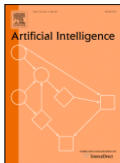
Artificial Intelligence Journal