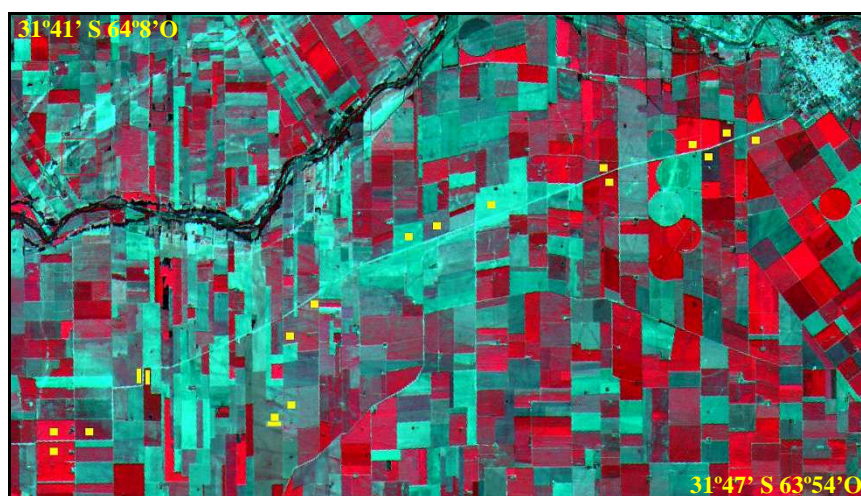
Fig. 1. Área de estudio en Córdoba, Argentina (Imagen LANDSAT). Marcas amarillas indican los lotes relevados. Figura adaptada de [2].

Los datos de cobertura de suelo por cultivo de soja y maíz (179 en total) fueron relevados continuamente a lo largo de la estación de crecimiento de ambos cultivos, en 33 lotes, los cuales son representativos de la zona por la homogeneidad y tipo de uso del suelo del área. Dado que en el área cultivada la relación entre los lotes sembrados de maíz con respecto a soja era, en el momento del estudio, del 26% [7], el número de lotes registrados para cada tipo de cultivo fue de 7 sembrados con maíz y 26 con soja. Todos los lotes comprendían un área mayor que 50 ha, a fin de ajustarse a la resolución del sensor MODIS.