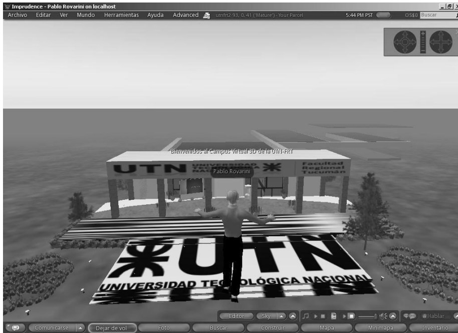
Fig.8. Vista aérea del prototipo UTN FRT