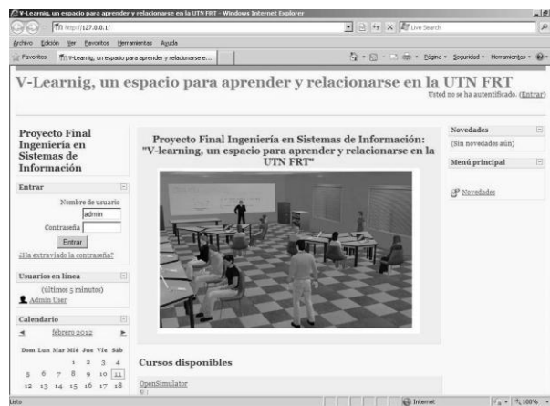
Fig.6. Acceso a Moodle

Aplicación que pertenece al grupo de los Gestores de Contenidos Educativos (LMS, Learning Management Systems), también conocidos como Entornos de Aprendizaje Virtuales (VLE, Virtual Learning Managements), un subgrupo de los Gestores de Contenidos (CMS, Content Management Systems). Una aplicación para crear y gestionar plataformas educativas, es decir, espacios donde un centro educativo, institución o empresa, además gestiona recursos educativos proporcionados por docentes y organiza el acceso a esos recursos para los estudiantes [4].