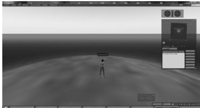
Fig.4. Primera Vista de OpenSim

Simulador 3D libre y de código abierto que utiliza los mismos estándares que Second Life (SL) para comunicarse con sus usuarios. Esto hace posible que los usuarios puedan utilizar el mismo software que provee Linden Labs (empresa que creó Second Life) para conectarse a un servidor controlado por organizaciones o individuos sin relación con esta empresa [2].