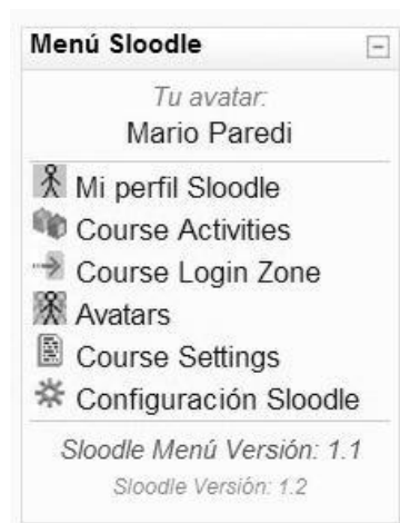
Fig.5. Menu Sloodle en Moodle

Proyecto Open Source (de código abierto) cuyo objetivo es unir las funciones de un sistema de enseñanza basado en web (LMS del inglés Learning Management System o VLE de Virtual Learning Environment) con la riqueza de interacción de un entorno virtual multiusuario 3D (MUVE de inglés Multi User Virtual Environment) [3]. Actualmente todo el desarrollo de Sloodle se basa en la integración entre Moodle y Second Life. De igual manera se puede lograr una combinación de Moodle y OpenSim obteniendo así un desarrollo libre.